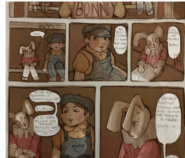
Particolari dei fumetti di : G. Raccuglia e del lavoro di gruppo della classe IVD