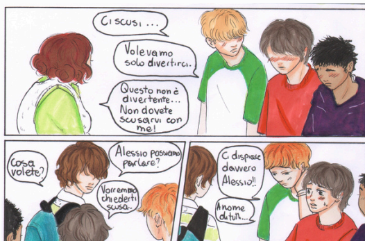
Particolari dei fumetti di : G. Scrima , F. Cardinale.

Gli studenti hanno seguito un breve laboratorio di scrittura creativa per realizzare sceneggiature per fumetti ed infine, all'interno del laboratorio di fumetto, hanno realizzato i fumetti oggi esposti.